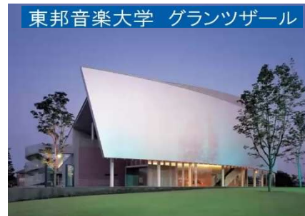
東邦音楽大学 グランツァール