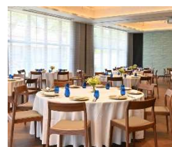
バンケットルーム