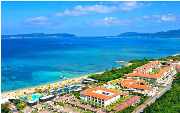
広大な敷地! 端から端まで 1.2 km 敷地面積: 86,000 平米 客室総数: 398 室