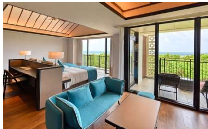
コーナースイート