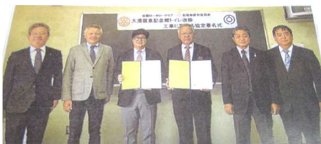
60周年事業の大演信泉記念館トイレ改修工事締結式の報告もできました。