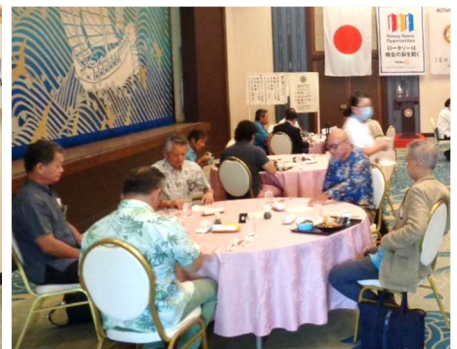
パナーのプレゼント！江田署長、ご来会ありがとうございました。