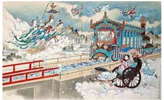
地獄ではなく極楽へ！

皆さん、こんにちは。8 月 13 日、14 日、15 日とお盆がありますけれども、こちらでは旧暦でありますが、60 年に一度くらいですかね、たまたま3 日間が重なるというのはなかなか無いことです。一日位は重なる場合がありますが、3 日間重なるという特別なお盆になるわけです。お盆に因んで今日は「地獄のお話し」をしたいと思っております。今日が旧暦の七夕の日で、昨日から3 日間、うちの本堂で地獄極楽図の展示会をしておりまして 9 時～6 時の間に展示しております。そして来た方にはいろいろな説明をします。今日は映像もありますので皆さんにも「地獄とはなんぞや」というのを観てもらいたいと思っております。天国というのはキリストの方の言い方で、仏教では極楽浄土と言います。最近では地獄の方が面白いということで落語でもあります。地獄はこういうところというのを分かりやすく撮れています。今日は時間がないのでビデオを観ていただいて、次回に改めて卓話でお話しさせていただきたいと思っております。よろしく願いいたします。