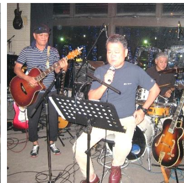
即興でバンド結成