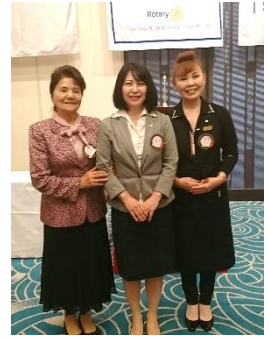
女性会員でパチリ