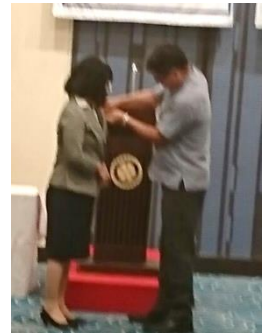
会長からバッチの贈呈

台北大同RC35 周年式典・祝賀会訪問 2019年4月18日 Sheraton Grand Taipei Hotel