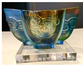
クリスタルの素敵な置物を 記念品に頂きました。