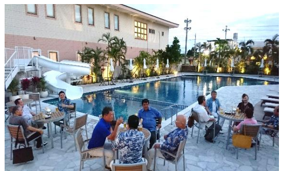
とても良い雰囲気の中、親睦を深めました。