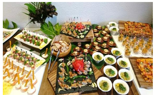
料理はbuffestail、美味しく頂きました！