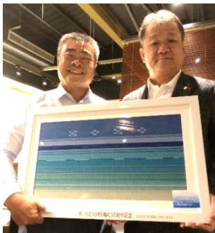
記念品にミンサー額装を！