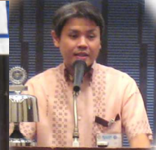
那覇東RCの與那城会長にご来会頂きました。