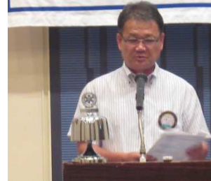
3名の会員に報告をしてもらいました。