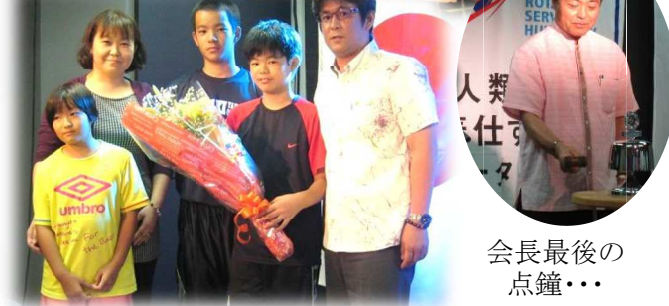
会長最後の 点鐘・・・