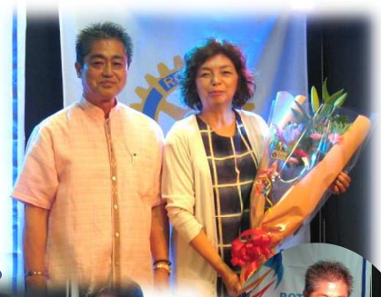
前木会長、前原幹事 一年間お疲れ様でした。