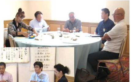
今年度最終の 通常例会