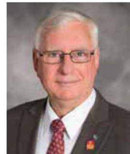
2017-18年度国際ロータリー会長 イアン H.S. ライズリー