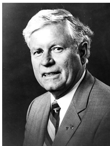
1988～89年度 RI会長 ロイス・アビー (豪州・エッセンドンRC)