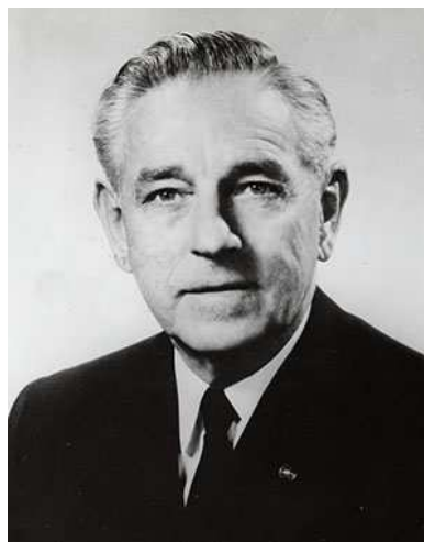
1963~64年度 RI会長 カール P. ミラー (米国・ロサンゼルスRC)