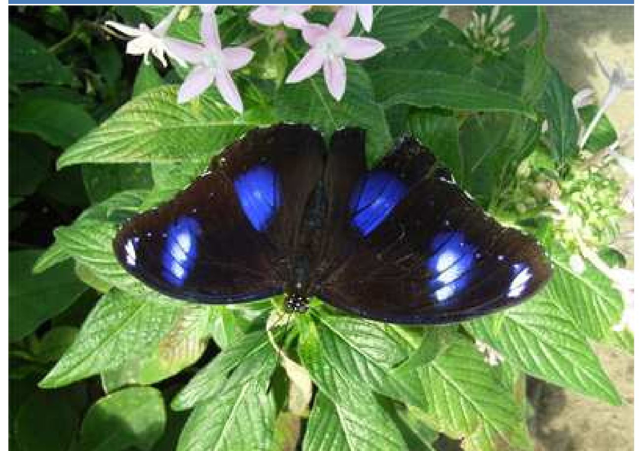
●リュウキュウムラサキ(タテハチョウ科)

オスの表面は金属光沢をした紫色が鮮やかな蝶です。またオスは天気が良い時は樹上などにとまって縄張りを見張っています。