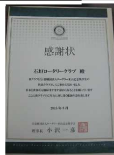
米山記念奨学会から感謝状を頂きました。