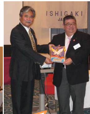
記念にバナーを贈呈！