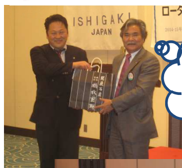
春日部西 RC からお土産を戴きました。